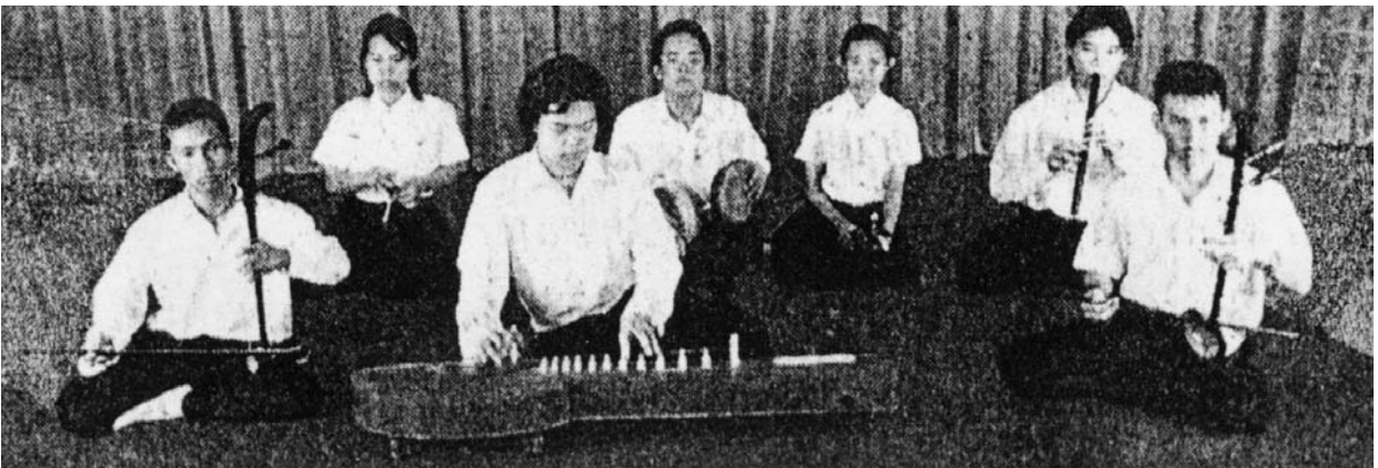
ที่มาของภาพ : คู่มือการจัดการเรียนรู้กลุ่มสาระการเรียนรู้ศิลปะดนตรี ม.4, 2546